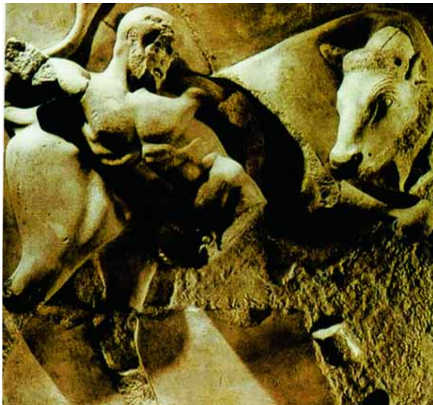
Metopa con una delle fatiche di Ercole, Tempio di Zeus, Olimpia

C'è anche un riferimento a semplici operazioni chirurgiche sul bestiame, corredate da istruzioni per le medicazioni, rimedi contro i parassiti, contro il morso di vipere e ragni e contro le sanguisughe ed è descritto anche una specie di travaglio da usare per la cura