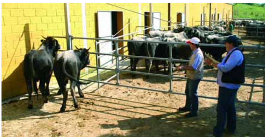
Esperti al lavoro con la Podolica

morfologica e sono stati, come di consueto, un importante momento di socializzazione e di scambio tra esperti che operano in realtà diverse.