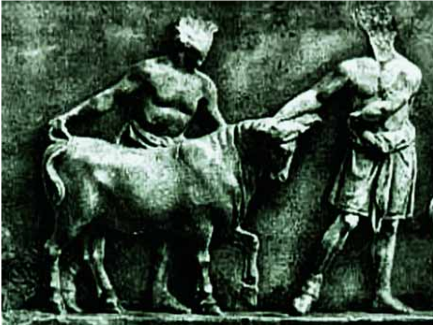
Sacrificio, Ara Pacis, Roma

ni (IV, 11), in quanto lo scarso ingrassamento evidenzia bene le caratteristiche fisiche, non mascherate dal buono stato nutrizionale.