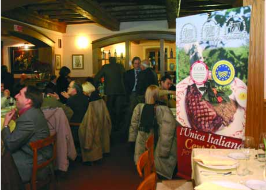
La cena presso il ristorante il Melone