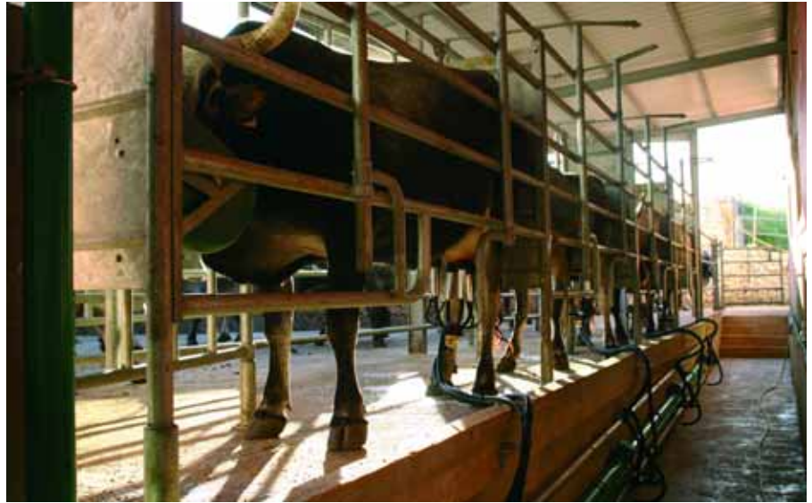
La sala mungitura

L'ingrasso dei vitelloni, annualmente circa trenta soggetti, avviene in azienda facendo ricorso in massima parte ad alimenti di produzione propria. I soggetti ingrassati vengono poi venduti ad una macelleria