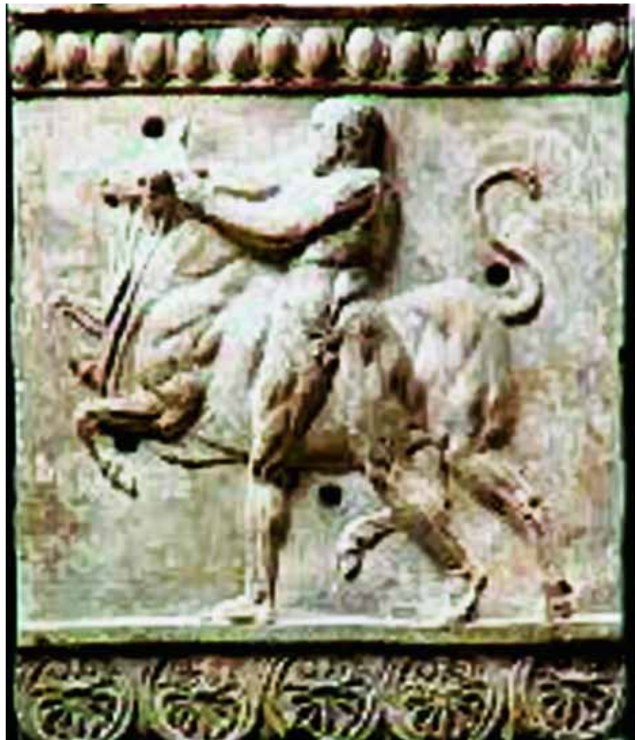
Ercole e il toro di Creta. Bassorilievo in terracotta di epoca Romana

Anche per le vacche (VI, 21), sono consigliate grandi dimensioni corporee, ma con una maggiore leggerezza negli arti e negli unghioni rispetto ai buoi da lavoro; altri temi sono direttamente ripresi da Varrone, pur senza citarlo, come il racconto della presunta predizione del sesso del nascituro a