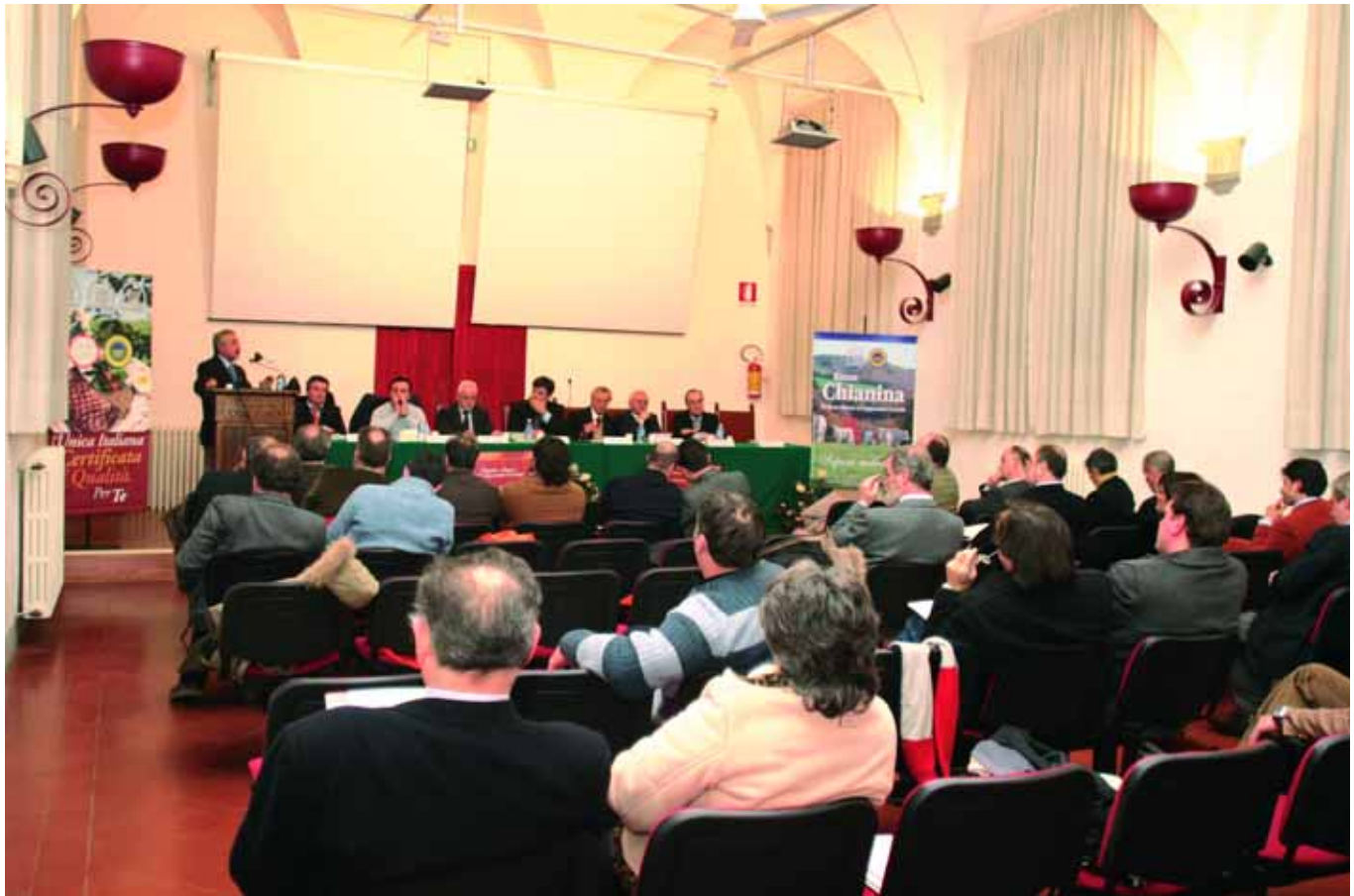
La sala convegni del Convento di Sant'Agostino a Cortona

P romossa dall'Associazione Nazionale "Città della Chianina", si è tenuta il 27 gennaio scorso, a Cortona (AR) presso il Convento di Sant'Agostino, la Tavola Rotonda "Dalla Fiorentina alle eccellenze del territorio - Prospettive e sistemi per la zootecnia".