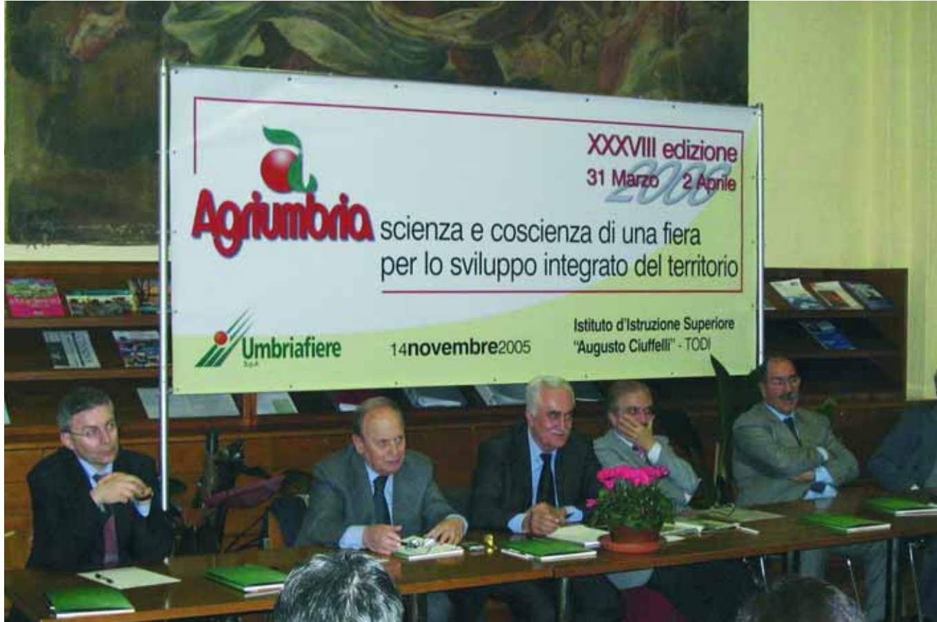
Il Comitato Tecnico Consultivo di Agriumbria