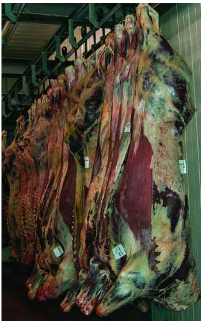
Carcasse di vitellone in un moderno impianto di macellazione