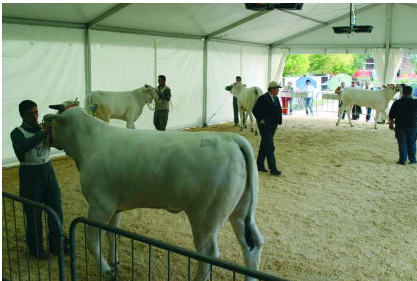
La finale delle femmine junior alla Nazionale Chianina 2005

di Matteo Ridolfi Ufficio Valutazioni Morfologiche