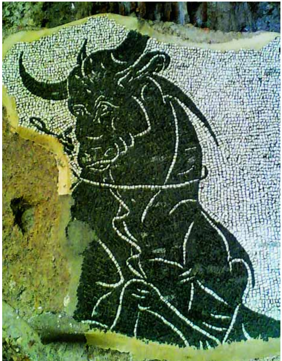
Mosaico. Terme di Caracalla, Roma

Columella si occupa poi delle razioni per i bovini (VI, 3), consigliando di adattare alle risorse disponibili, privilegiando il pascolo, quando possibile, perché più economico e, in assenza di esso, usando fieno, leguminose (veccia, cicerchia, lupino, ervo), granella d'orzo, paglie di graminacee e vinac-