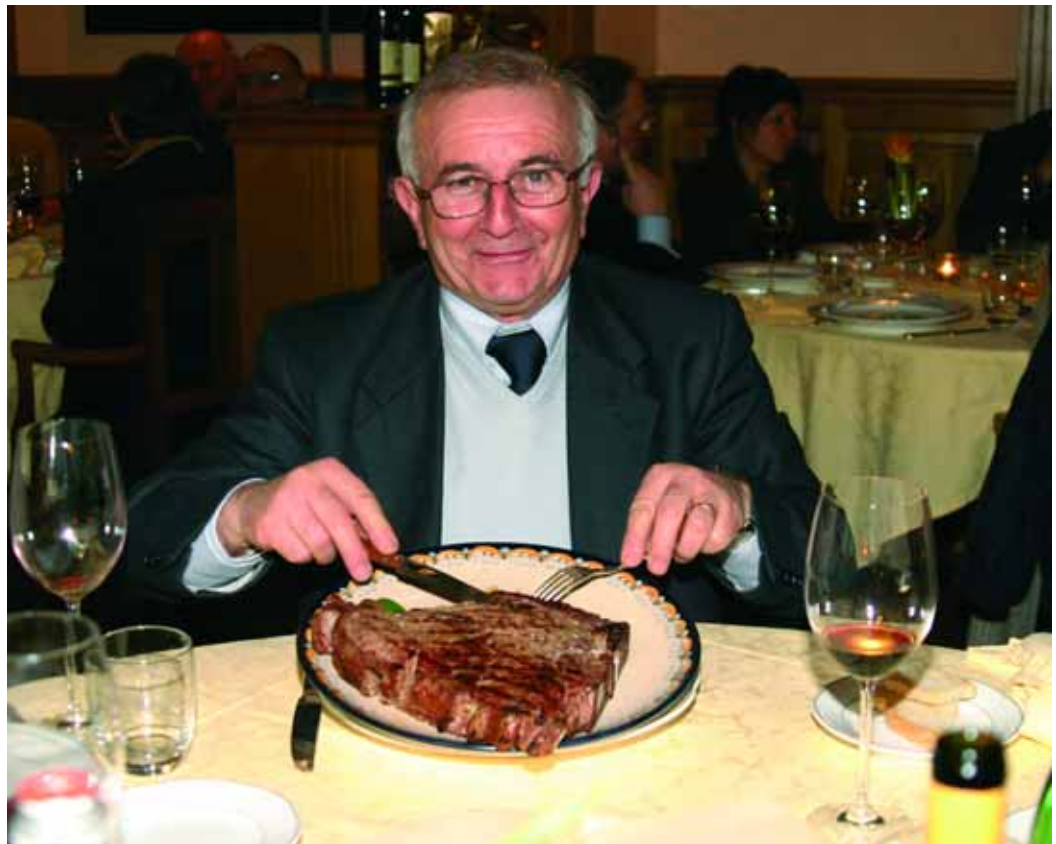
Il sindaco Renzi alle prese con la "Fiorentina ritrovata"