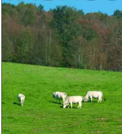
Bovini Marchigiani, Alto Piano del Voltigno - Pescara

Periodico dell'Associazione Nazionale Allevatori Bovini Italiani da Carne