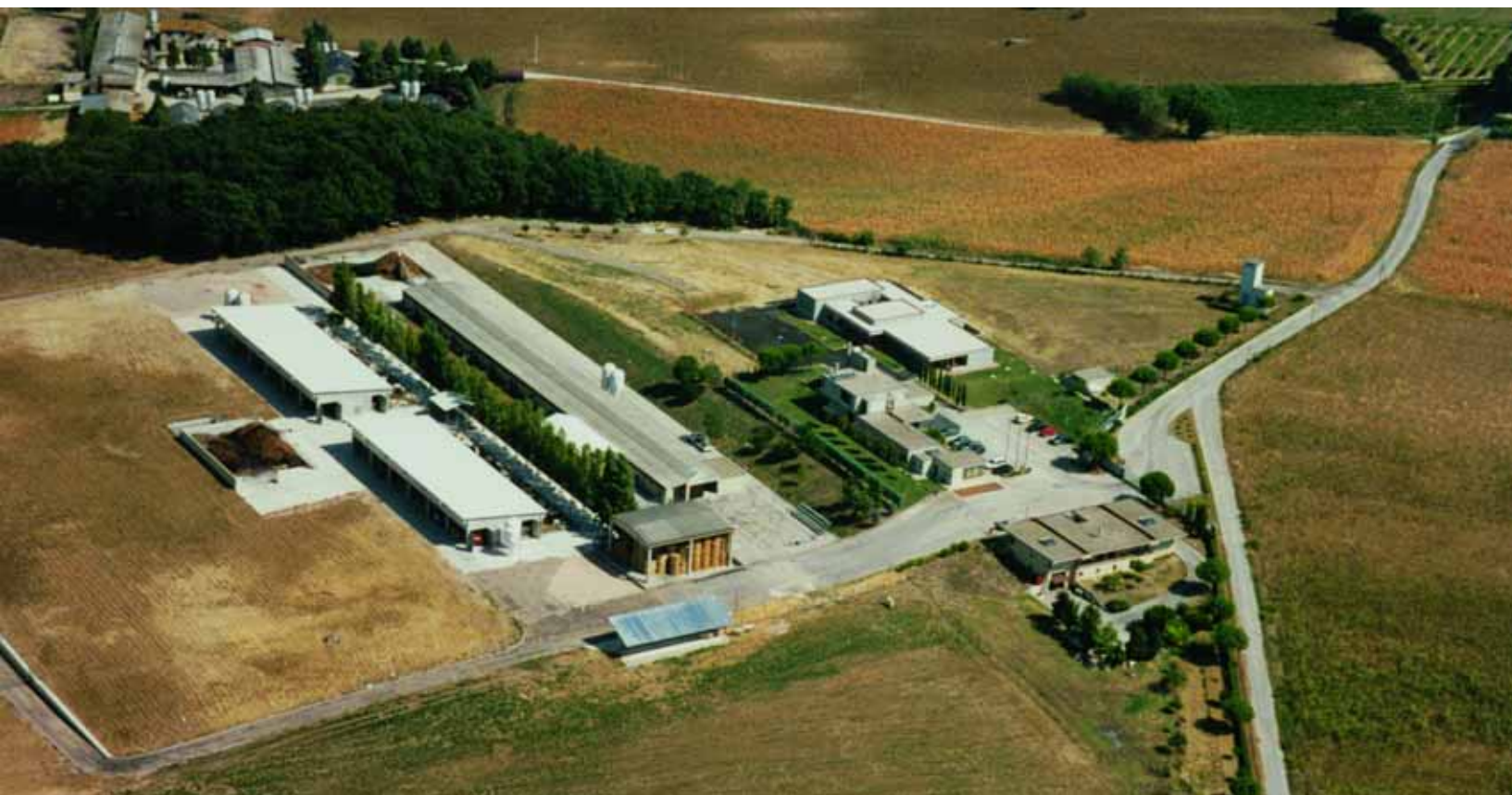
Il Centro Genetico delle razze Chianina, Marchigiana e Romagnola - San Martino in Colle PG

C om'è noto, nel settembre scorso una infezione da virus BHV-1 responsabile della Rinotracheite Infettiva Bovina (IBR) ha determinato la sospensione delle prove di performance presso il Centro genetico di Perugia.