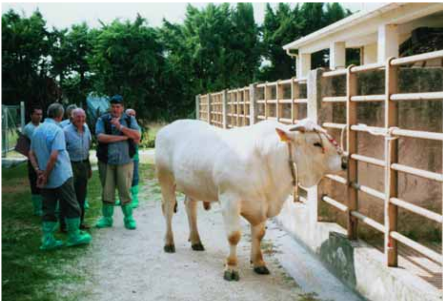
L'aggiornamento degli esperti marchigiani